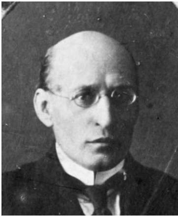
П.А. Іванов, засновник школи епізоотологів ХВІ

Найбільш яскравими представниками цієї школи були професори І.І. Лукашов, М.Г. Нікітін, В.І. Ротов.