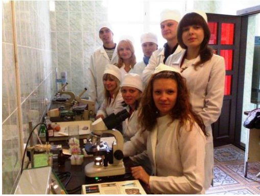
Студенти ФВМ на практичних заняттях з лабораторної справи