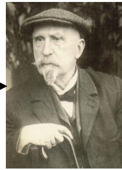
П.М. Кулешов (1854 – 1936)