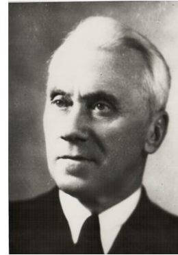
М.Д. Потьомкін (1885 – 1965)